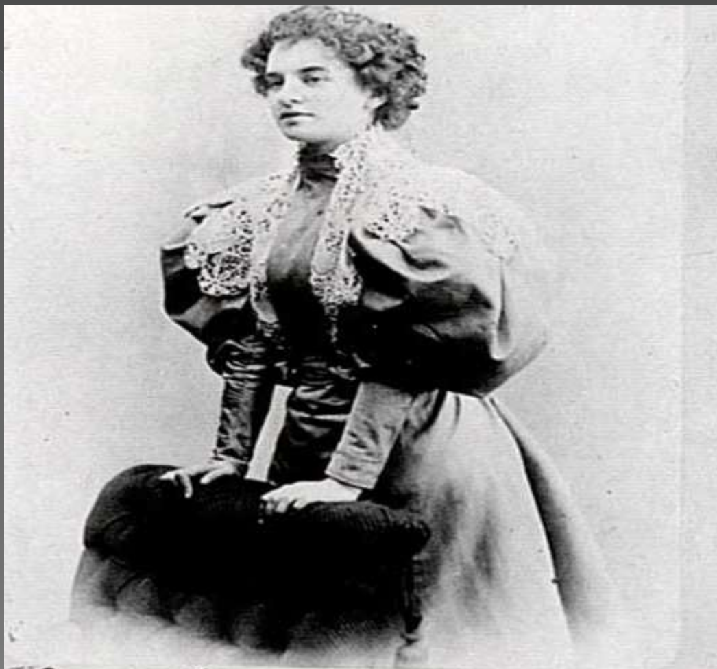
Эдуард Бенксман портрет Миссис Рейнхольд от Ф. Кемпера. Мейсбург.